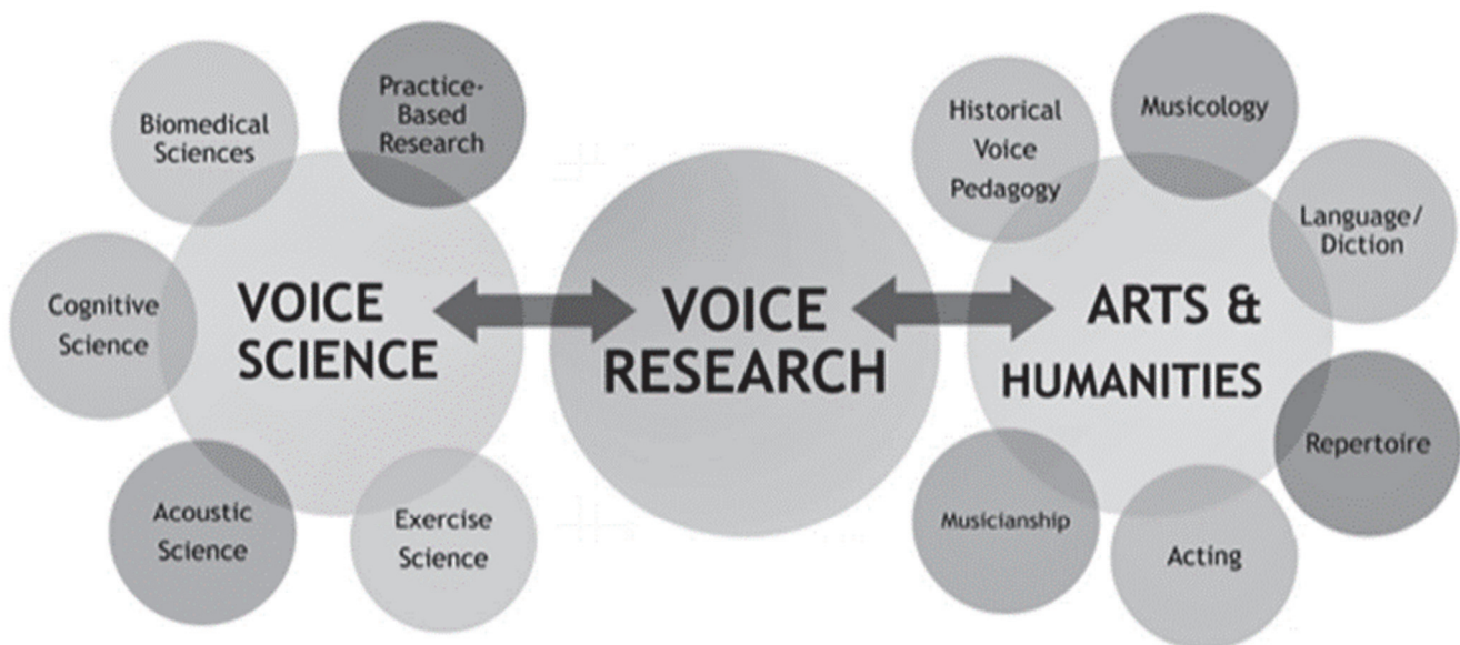
EVIDENCE-BASED VOICE PEDAGOGY (EBVP): VOICE RESEARCH COMPONENT

Ragan en Maxfield wijzen op twee wetenschapsdisciplines die onderzoek doen dat van belang is voor de zangpraktijk. Het gaat dan om de exacte poot van ‘Voice science’ (natuurkunde, biologie, geneeskunde) en de meer interpretatieve aanpak van ‘Arts and Humanities’, de sociale wetenschappen met kunsthistorie, talen, linguïstiek, filosofie en pedagogiek. Voor de exacte vakken is vaak veel meer onderzoeksgeld beschikbaar, waardoor de nadruk vaak erg op die hoek komt te liggen.